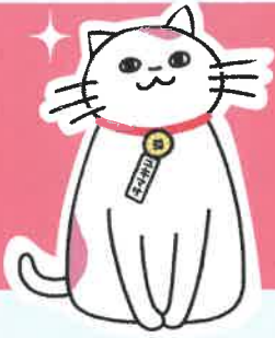
日本行政書士会連合会公式キャラクター 『ユキマサくん』